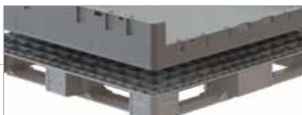
Sección transversal de nuestra tecnología de vigas en I soldadas que incrementa la resistencia de la base hasta en 40%

Durable: la construcción única de "vigas en I" de Monoflo es un diseño soldado de dos piezas que produce la base más resistente y durable de la industria.