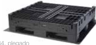
BC 4844.5-34, plegado