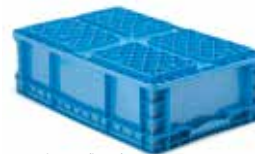
NSO 2415-07, base plana (izq.), base para apilamiento entrecruzado (der.)