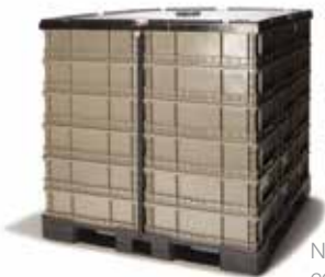
NSO 2415s en tarima SP4845-5-IMW-II con tapa superior que incluye cinturones de seguridad