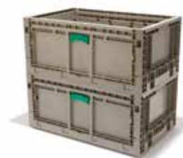
KD 2415-09 dos apilados