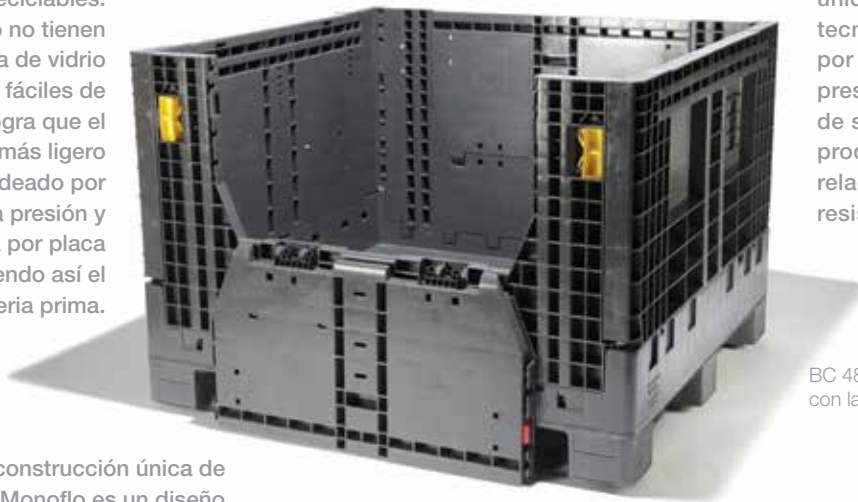
BC 4844.5-34 con la puerta de acceso abierta

Desempeño comprobado: nuestra combinación única de la más reciente tecnología de moldeo por inyección a alta presión y nuestro proceso de soldadura comprobado produce la mejor relación disponible entre resistencia y peso.